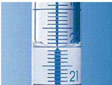
Figura 2 – Banda Schelbach

A iluminação e a cor e textura da parede por detrás do instrumento a calibrar devem ser adequadas a uma perfeita visualização do perfil do menisco. Quando necessário, pode ser utilizada uma lupa ou microscópio óptico (catetómetro).